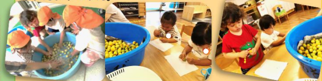
カタツムリも見つけたよ😊

「梅は、いろんな食べ物になっているんだけど、知っているかな?」と、いくつかの食品を見せて聞いてみると、梅干しも「知ってる〜ご飯と食べるの!」「食べたことある」「食べてみたい」ということで、こりす組では、「ジュースにするのはどう?」と提案しました。子どもたちから「いいね〜」と賛成のお返事をもらい、梅シロップを作ることになりました🍷 持ち帰った梅をたらいでジャブジャブ洗ったり、へた取りもしました!「梅にはおへそみたいなへたがあって、これを取らないといけない」と伝えると「やりたいやりたい〜」そして、爪楊枝で真剣そのものですが出来ました🍷 やりたい事への子どもたちの集中力に驚きました!🍷 3週間程でできるそうですので、日々の変化を楽しんで観察!たいです。